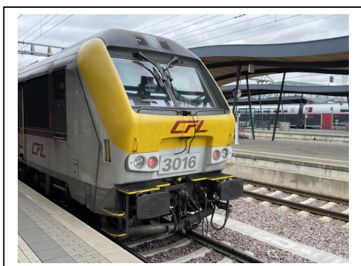
Tirage limité à 220 exemplaires