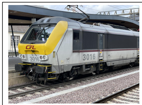
nouveau logo CFL